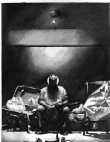
Was Teil, was die Wiedergabe eines Bildes zu gestalten: Hillem von Michael Ondaatje. Ein Foto zeigt die Ver- folgungsjagd, während Hillmann mit einer Kamera auf der Straße in San Francisco wandert und denen einen Lebensentwurf bietet.

In den Dialogsequenzen wiederum bleibt Hillmann meist mit den Figuren im Raum und erkundet die Dynamik dessen, was da geschieht: Wie stehen die Figuren zueinander, wessen Körperhaltung zeigt, dass er im Augenblick die Oberhand hat, mit welcher Geste wird ein Foto betrachtet - und welche Lichtflecken wirft die kalifornische Sonne ins Zimmer. Hier ist der Leser dann damit beschäftigt, zwei ganz unterschiedlichen Erzählungen zu folgen: Die Lektüre der Dialoge erzählt die Story und würde vollkommen ohne die Bilder auskommen. Doch wer gleichzeitig ein Gefühl für die Raumtemperatur und den Geruch der Möbel bekommen möchte, der kann die Illustrationen studieren.