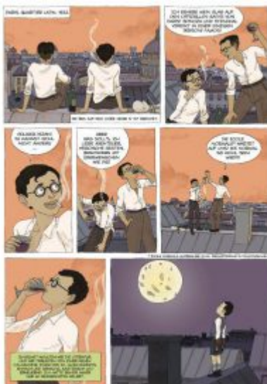
A. Depommier, M. Ramadier – Sartre. Abb: Egmont Verlag

Ästhetisch reißt aber Depommier mit seinen Zeichnungen noch einiges heraus. Mit einer matten, nostalgisch und retrospektiv wirkenden Farbgebung taucht er in das Leben der Pariser Avantgarde ein und zeigt atmosphärisch und affirmativ das Kaffeehausleben der Intellektuellen, die durch Ereignisse wie dem Zweiten Weltkrieg oder dem Unabhängigkeitskampf Algeriens, aus der Reserve geholt werden. Oder ihre